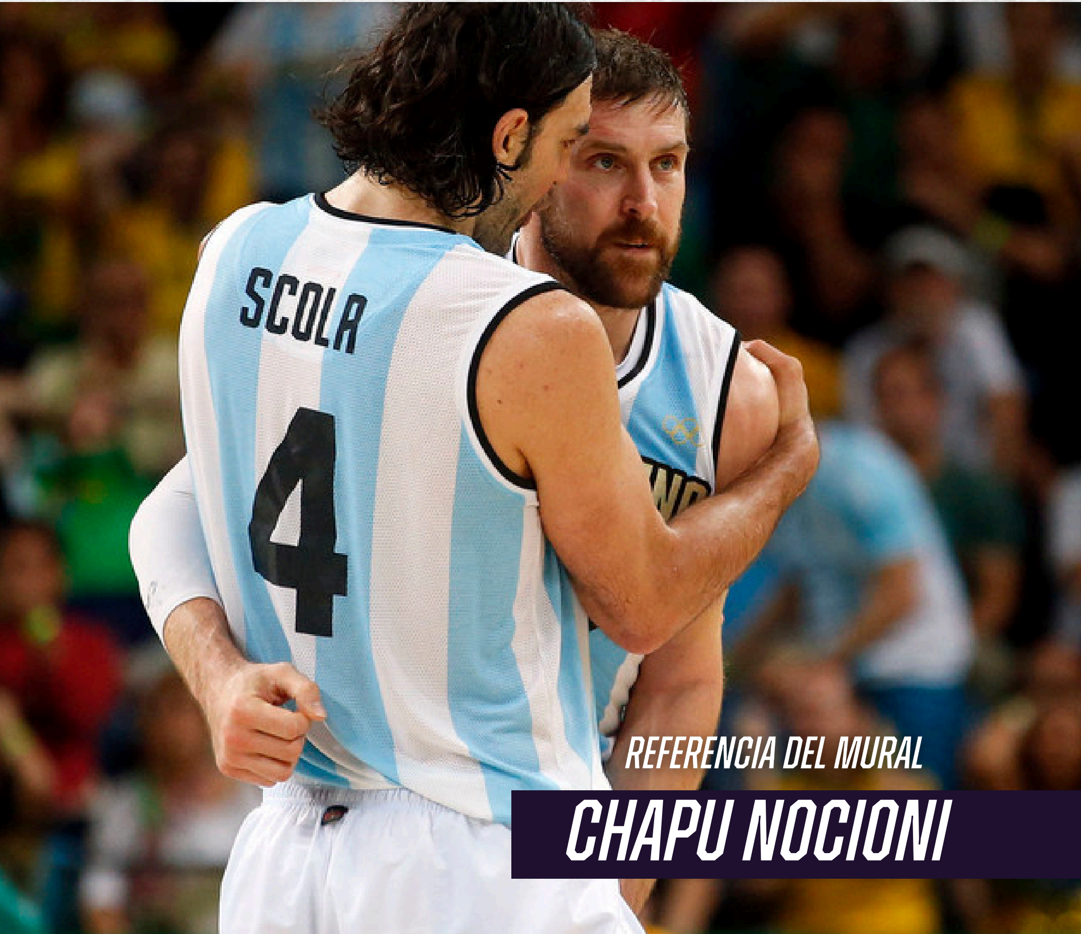
REFERENCIA DEL MURAL